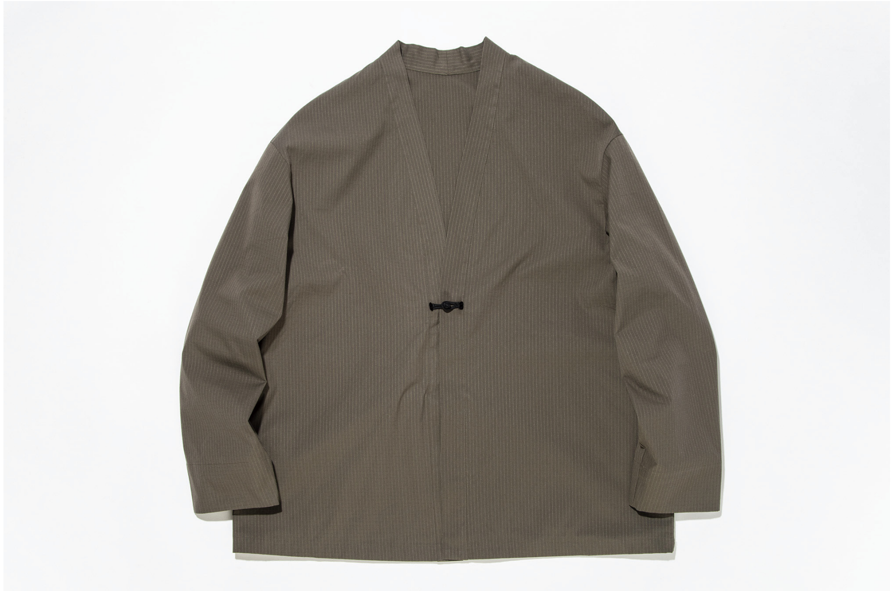
COOL MAX HAPPY CARDIGAN “Dustin”

こちらはリップストップのストレッチクールマックス素材を採用した1Bカーディガンです。作務衣を思わせるようなデザインに機能性の高い素材を合わせることで洗練された一着に。吸水速乾性に優れているので、暑い日にも快適に着用できます。ゆったりとしたシルエットで一枚で着るのはもちろん、インナーにして素材感のレイヤードを楽しめる3シーズン対応可能なアイテムになりました。フロントあきにはフロッグボタンを使用、サイドにはシームポケットが付きます。